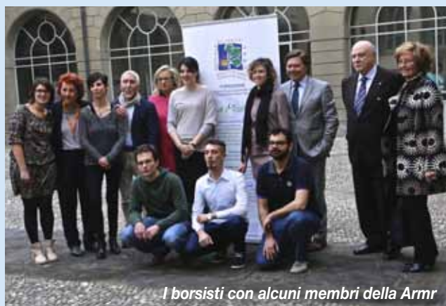
I borsisti con alcuni membri della Armr

20 aprile 2015 Scritto da Roberta Martinelli